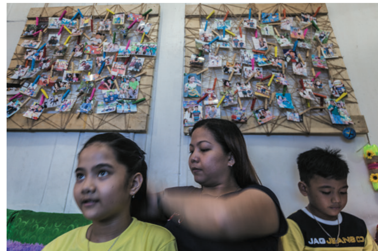
Un gran mural con fotos de Nicole y su hermano preside la estancia principal de la casa.